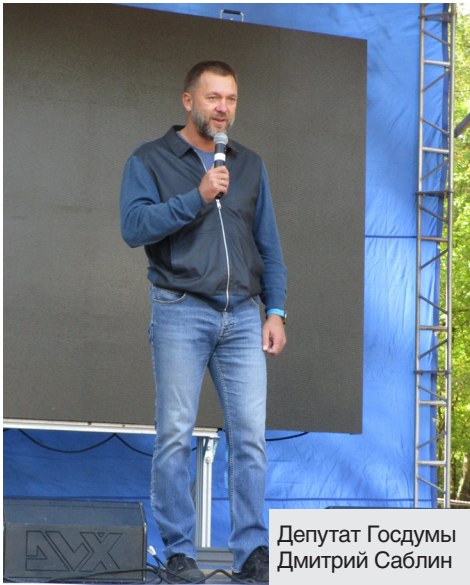
Депутат Госдумы Дмитрий Саблин

Военно-спортивные соревнования с таким названием прошли в ТиНАО в пятый раз