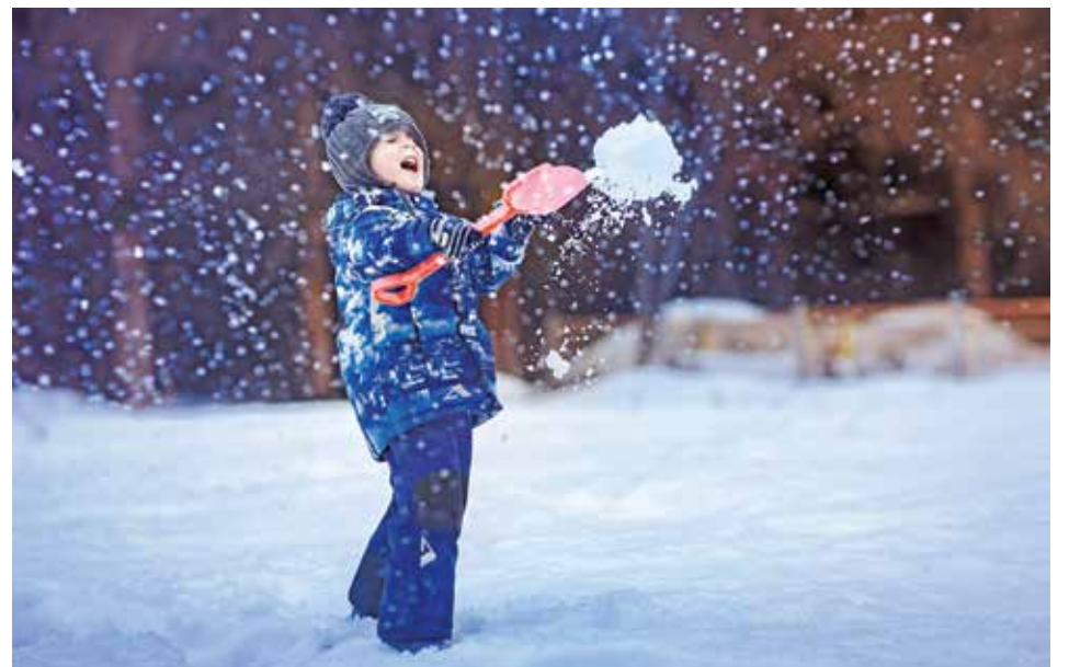
Фотография «Банзаааай!», автор – Екатерина Могилат

Увидеть работы призеров конкурса и других его участников можно в Доме культуры «Московский». В общей сложности на выставке представлено два десятка лучших работ.