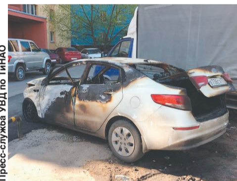
Пресс-служба УВД по ТиНАО

По данному факту следственным отделом МО МВД России «Коммунарский» г. Москвы возбуждено уголовное дело по признакам преступления, предусмотренного ст. 159 УК РФ «Мошенничество». В отношении подозреваемого избрана мера пресечения в виде подписки о невыезде.