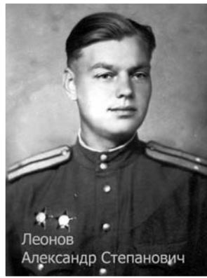
Леонов Александр Степанович