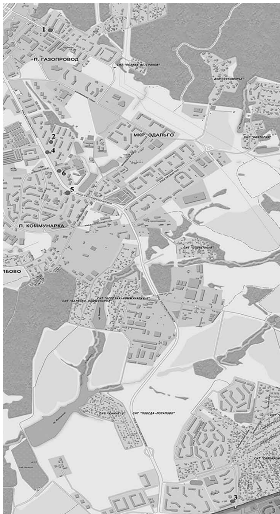
Схема размещения нестационарных торговых объектов на территории поселения Сосенское на период с 01.01.2018 г. по 31.12.2018 г.